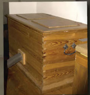
Das Kupferberger Positiv in der Werktagskapelle der Bamberger St. Jakobs-Kirche